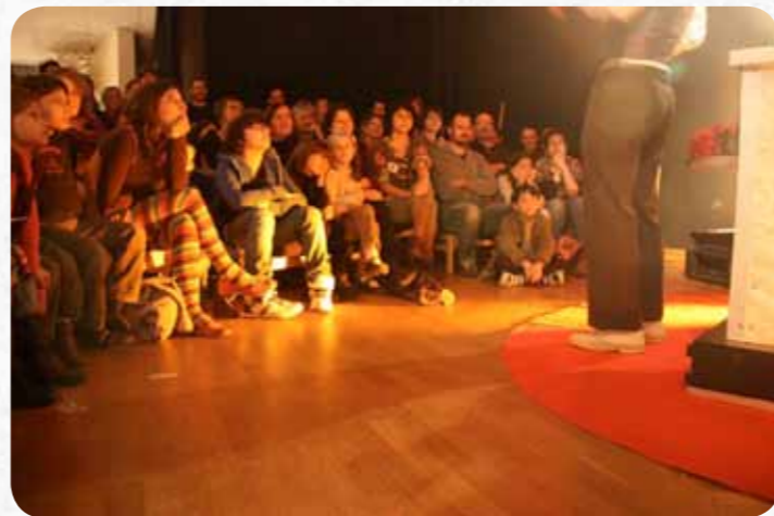
Cie Demain des Pieds - "Le Chemin des Dames"