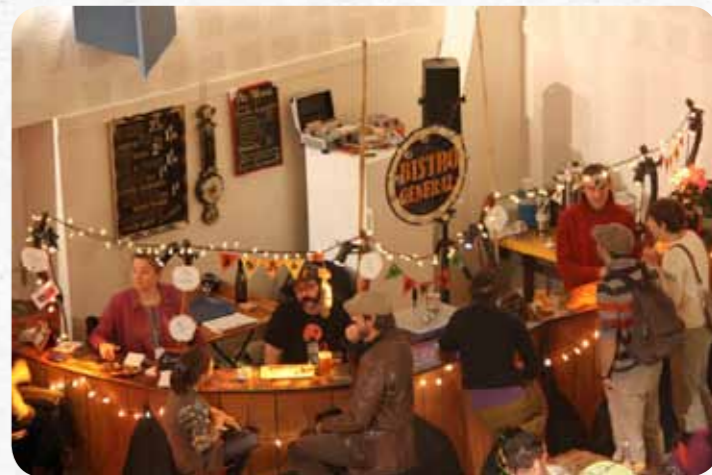
Le Bistro Général : bar et restauration