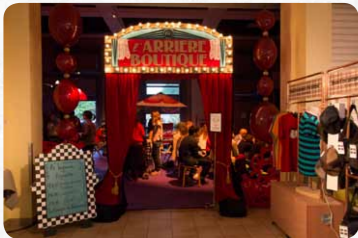
L'Arrière Boutique : espace avec bar, coin pour les enfants et scène pour les spectacles