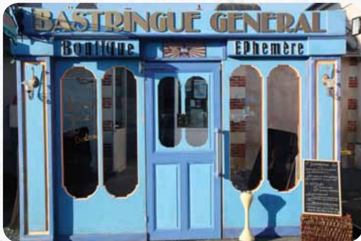
Devanture de la boutique éphémère