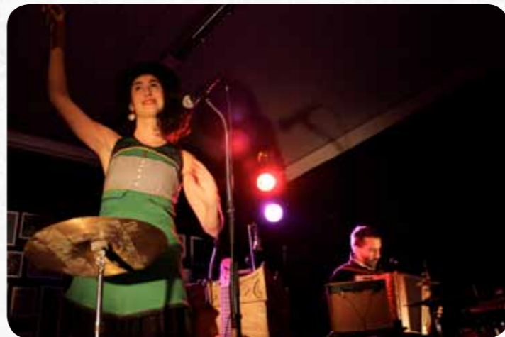
Nefertiti in the kitchen