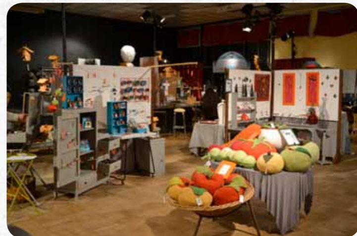
Espace d'exposition-vente scénographié, agencé et mis en lumière par une scénographe